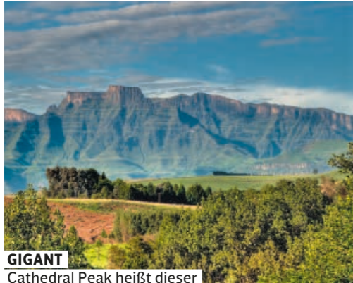
GIGANT Cathedral Peak heißt dieser Drakensberge-Koloss

Wir lassen uns ein auf den Rhythmus der Natur