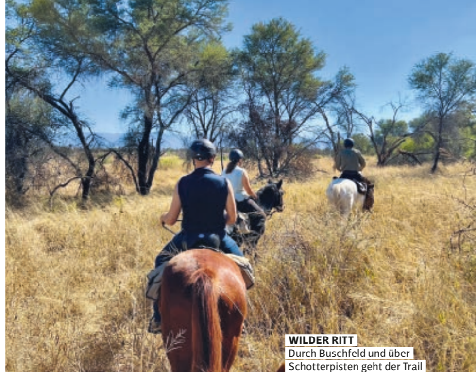
WILDER RITT Durch Buschfeld und über Schotterpisten geht der Trail

Wir lassen uns ein auf den Rhythmus der Natur