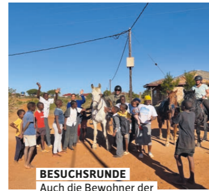
BESUCHSRUNDE Auch die Bewohner der Dörfer am Weg freuen sich über die Gäste zu Pferd